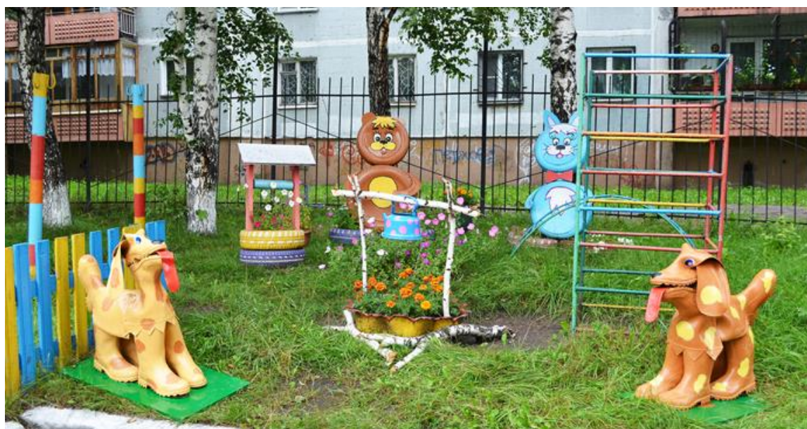
Ежегодная акция «Родители – детям»